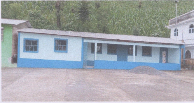
Foto1: Pintura y repello de interior y exterior de la escuela